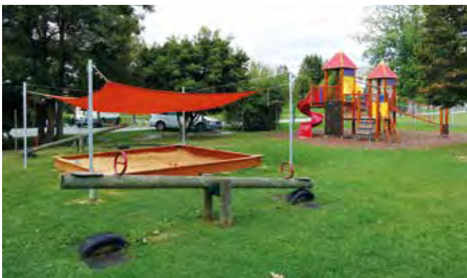
Der Spielplatz bei der Teichstub'n wurde teilweise erneuert und saniert.