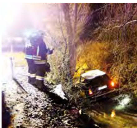
Alle Schutzengel hatte die PKW-Lenkerin, die von der Pfarrwaldstraße abkam und in den Tiefenbach geschleudert wurde.