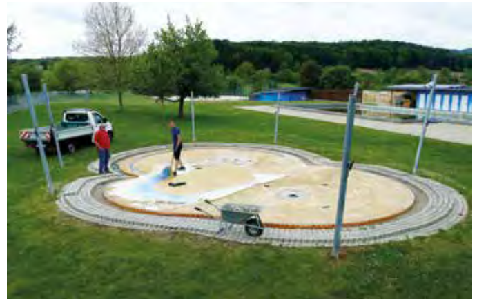
Die Sanierung des Planschbeckens im Freibad läuft gerade.