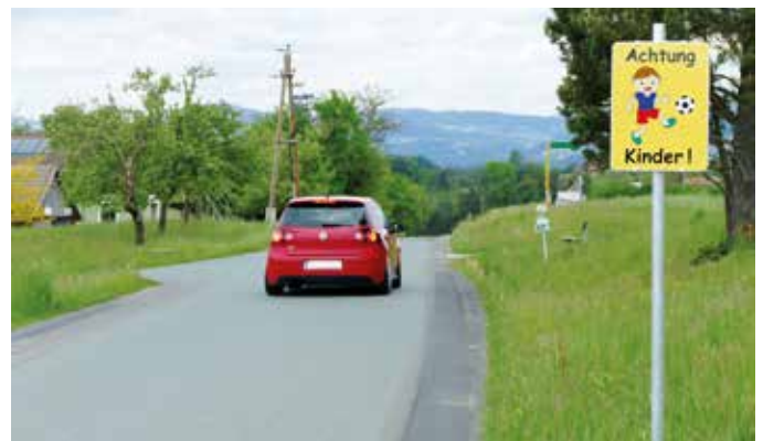
Neue „Achtung Kinder-Tafeln“ wurden im Gemeindegebiet aufgestellt.