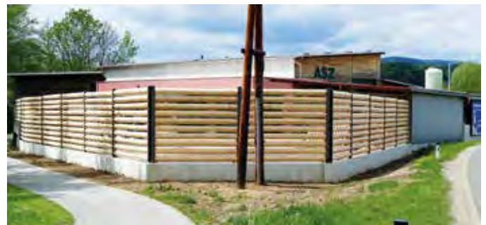
Der Platz für die Baum- und Strauchschnitte wurde neu errichtet.