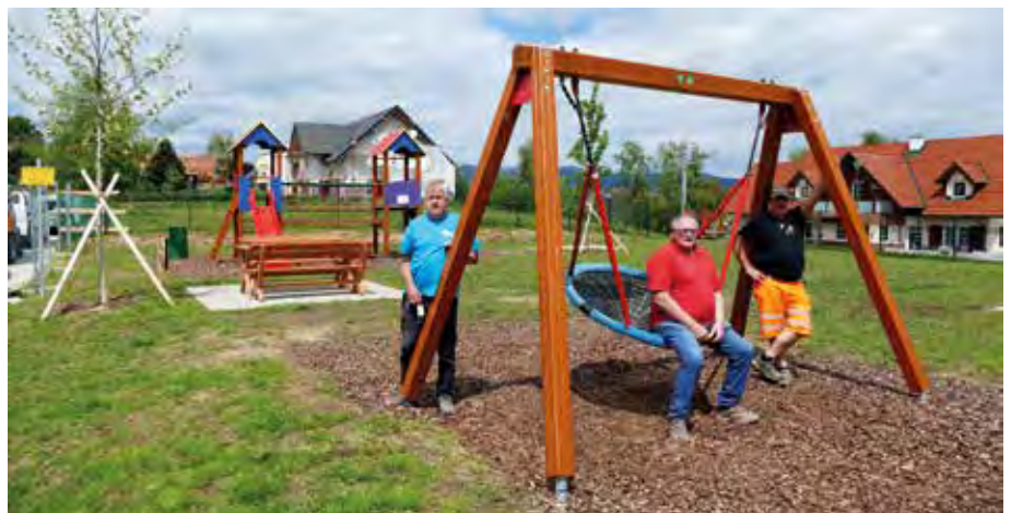
Der neue Spielplatz in der Sonnensiedlung in Hofkirchen