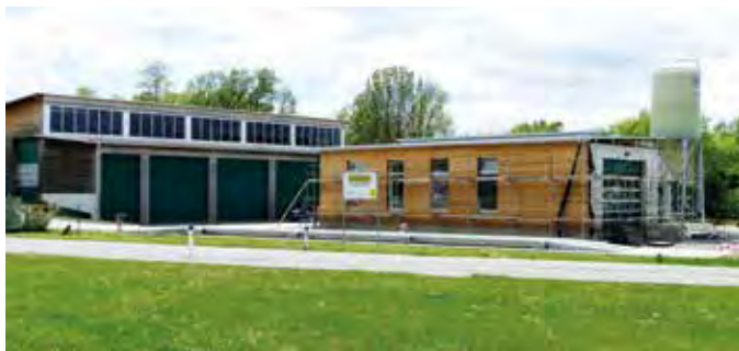
Die Bauhof-Erweiterung steht kurz vor der Fertigstellung.