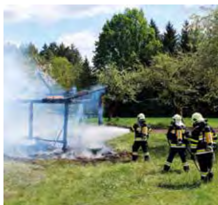
In Wagenbach löschte unser Atemschutztrupp den Brand eines Bienenhauses und verhindert so die Ausbreitung des Feuers.