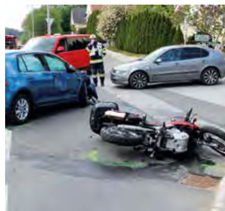
Eine Schwerverletzte gab es nach der Kollision eines Motorrades mit zwei PKW auf der B 54 in Hinterbüchl.