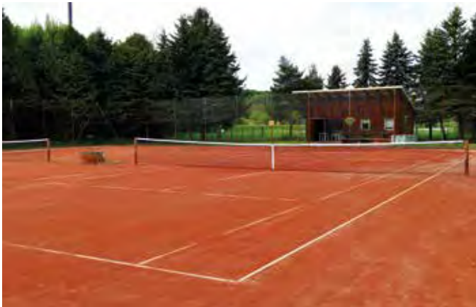
Der Tennisplatz in Kaindorf wurde saniert und ist wieder bespielbar!