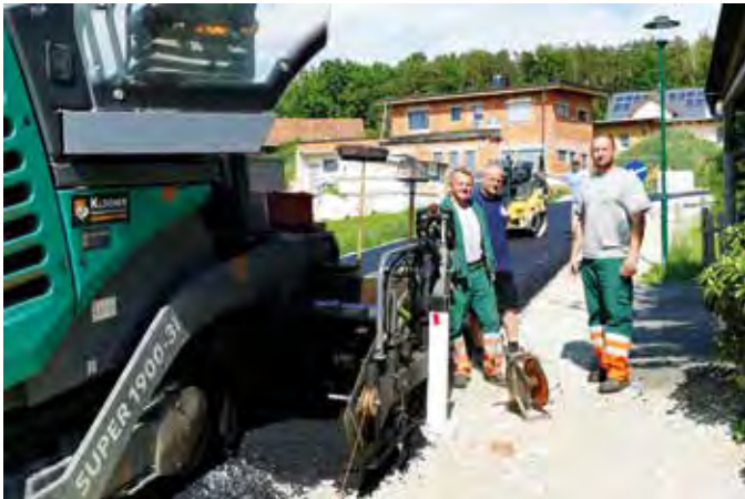
Die Arbeiter der Firma Klöcher-Bau beim Asphaltieren der Schloßbergstraße (vom Reitstall Rath bis zur Einmündung in die Kopfing-Dorf-Straße)