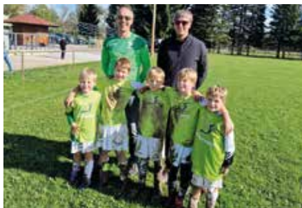
Die U8 zeigte vollen Körpereinsatz beim Turnier in Kaindorf