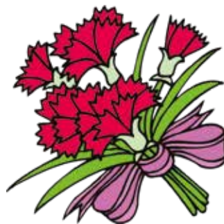
Wir gratulieren allen recht herzlich!