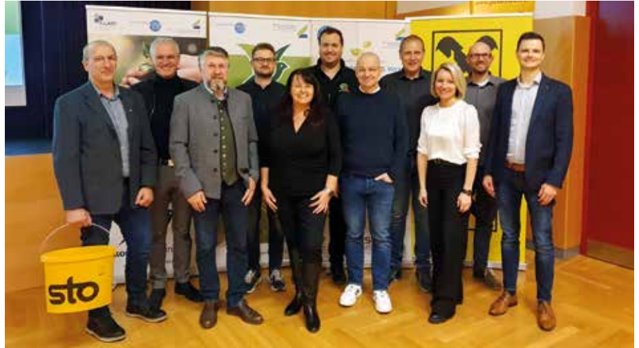
Sauber heizen für Alle ist ein Begriff! Aber mit „Sauber Sanieren“ ist die Steiermark Vorreiter in den Bundesländern, beides 100 % Förderungen, die noch auf Abholung warten!

Heizkesseltausch, außen und innen Dämmung, „atmende Wände“, Fenstertausch, PV-Anlagen mit Speicher- und Notstromlösungen sowie günstige Zwischenfinanzierungsmöglichkeiten bis die Förderung ausbezahlt wird, das Format bot für die Besucher ein Runduminfopaket und die Möglich-