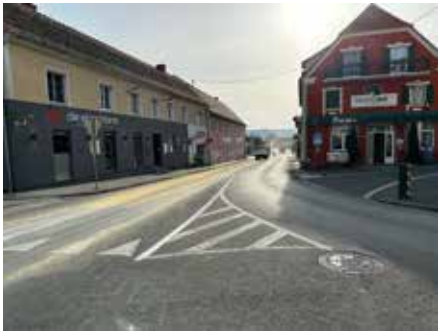
Gefährliche Situation: Durch eine kaputte Bordwand verliert ein Traktorgespann Mais auf der B 54 im Ortsgebiet.