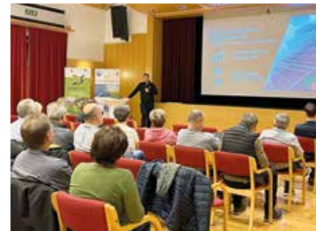
Kein Strom, was tun? Unsere Partnerfirmen haben Blackout Lösungen!