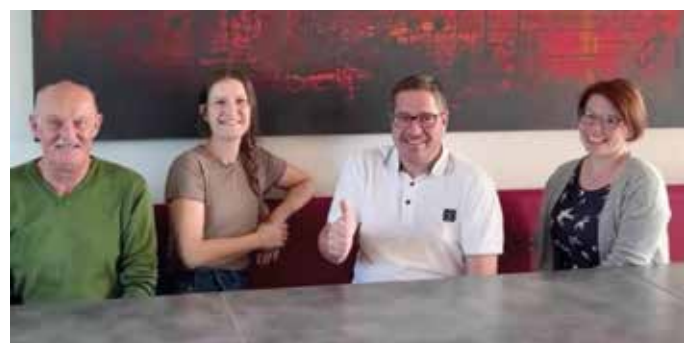
Gewinnübergabe der Firma Herbsthofer