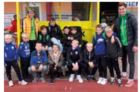
Die U12 nach dem Spiel des TSV Hartberg.