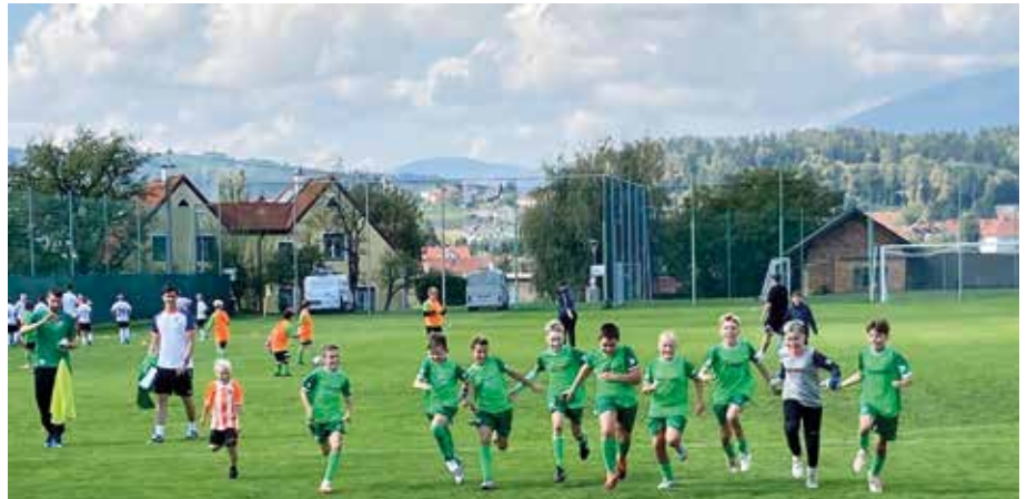
Die U12 jubelte über ihren Sieg in Krottendorf

Eine erfolgreiche Herbstsaison 2024 geht für die Fußballer und Fußballerinnen der Spielgemeinschaft Ökoregion zu Ende. Bei einigen Turnieren und Meisterschaftsspielen konnten die jungen Sportler/innen ihr Können unter Beweis stellen. Auch der Spaß kam dabei nicht zu kurz. Die U12 durfte am Nationalfeiertag mit den Spielern des TSV Hartberg bei einem Spiel miteinlaufen. Das war für alle ein besonderes Erlebnis.