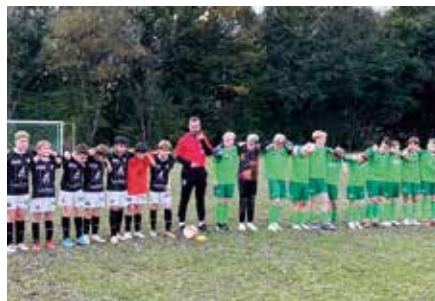
Die U12 beim Spiel in Kaindorf gegen Nitscha.