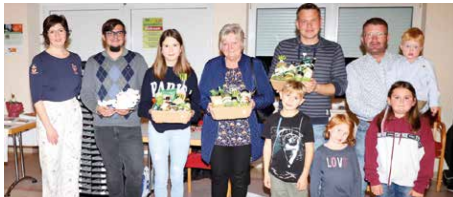
Die Verlosung wertvoller Preise bildete den abschließenden Höhepunkt des Gesundheitstages.