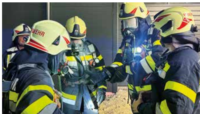
Gemeinsame Brandschutzübung mit der FF Mitterdombach beim Zubau Buschenschank Knöbl