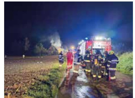
Ein Todesopfer nach tragischem Wohnhausbrand in Unterdombach