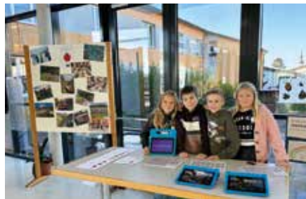
Stolz präsentieren die Schüler ihre Produkte

Beim diesjährigen Gesundheitstag präsentierten Schüler*innen und Lehrer*innen, wie wir im Schulalltag Gesundheit fördern. An unserem Stand gab es Rezepte-Fächer und eine 30-Tage-Challenge für zuhause. Die Besucher*innen wurden motiviert, sich täglich etwas Gutes zu tun. Die selbst erstellten Videos, die im Rahmen der UVÜ „Lego WeDo - iPad and you“ entstanden, zeigten die vielfältigen Aktivitäten im Laufe eines Schuljahres rund um Bewegung