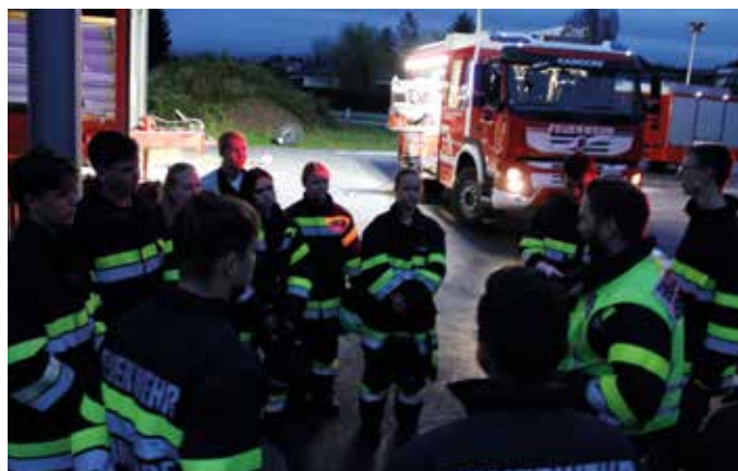
Die jungen Feuerwehrleute üben sehr intensiv verschiedene Einsatzszenarien