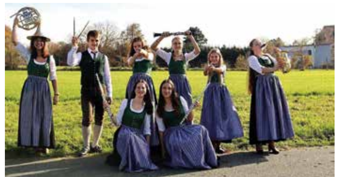
Unsere Jungmusiker:innen in ihrer neuen Tracht