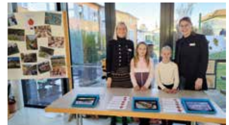
Stand der VS Hofkirchen beim Gesundheitstag der Ökoregion Kaindorf

und Wohlbefinden. So bekamen die Besucher*innen einen guten Über-