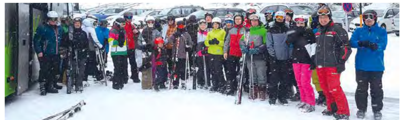
Trotz „Mistwetter“ ließen sich die fleißigen Schifahrer nicht unterkriegen.