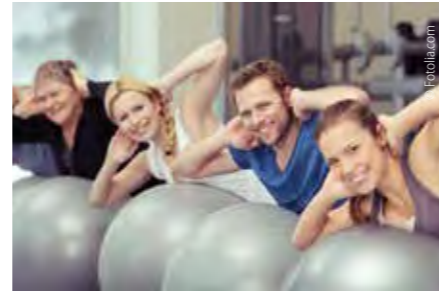
Meldung wären die Art des Angebotes, der Termin, die Kosten und die Kontaktdaten. ◀

Ihre Mithilfe ist gefragt! Alle Angebote in den drei Gemeinden der Gesunden Ökoregion (Ebersdorf, Hartl und Kaindorf) zum Thema Gesundheit & Bewegung sollen gesammelt in einer Gesundheitsbroschüre zusammengefasst werden! VON DAVID TEUBL