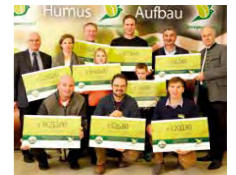
Am Humus-Fachtag wurden an nachhaltig agierende Landwirte Humus-Zertifikate im Gesamtwert von 35.000 Euro übergeben.