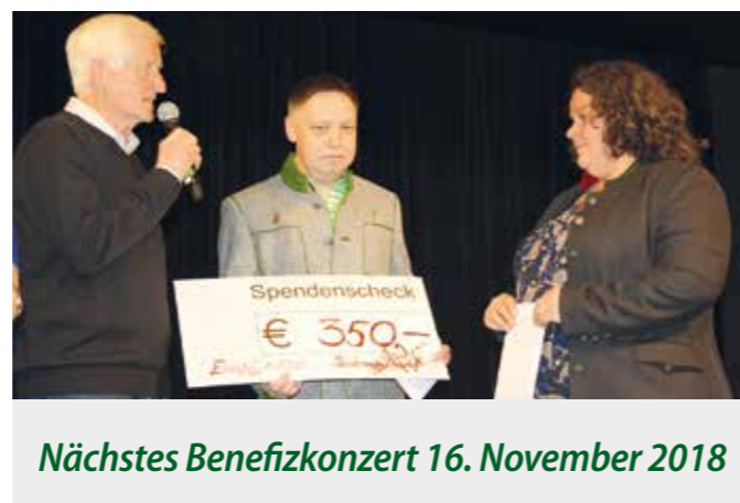
Nächstes Benefizkonzert 16. November 2018