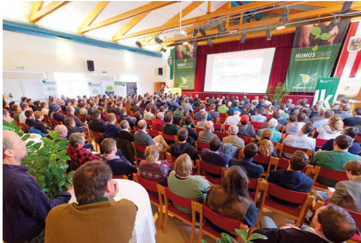
Geballtes Wissen: In der Kulturhalle in Kaindorf versammelten sich wieder Anwender und Experten aus dem gesamten deutschsprachigen Raum.

Von 22. bis 24. Jänner 2018 gingen die Humus-Tage in Kaindorf mit insgesamt rund 600 Teilnehmern über die Bühne. Am Rande der Tagung wurden Gespräche mit drei Nationen geführt, um das Humusaufbauprogramm in Europa auszuweiten. Erstmals waren auch 150 Fachschüler von 6 Landwirtschaftsschulen dabei. Landesrat Seitinger übergab zudem höchstpersönlich die Humus-Zertifikate an die Landwirte.