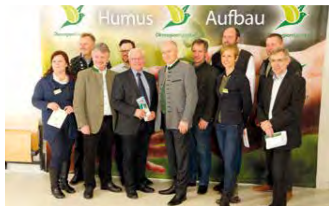
Premiere 1: Erstmals machte sich LR Johann Seitinger ein Bild vor Ort und freute sich über das große Interesse von regionalen und internationalen Repräsentanten.

Am Rande der Humus-Tage wurden mit Vertretern aus Slowenien, Bayern und Belgien konkrete Abstimmungsgespräche geführt, um das Humus-Aufbauprogramm der Ökoregion Kaindorf auch in diesen Ländern zu realisieren. Besonders unterstützt wurden die Humus-Tage u.a. von der Landwirtschaftskammer Steiermark und dem Tourismusverband Hartbergerland. ◀