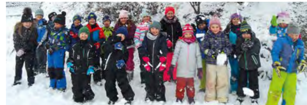
... Spielen im Schnee- das ist herrlich!...

war es endlich wieder so weit! Voller Freude nutzten die Schülerinnen und Schüler jede sich ergebende freie Minute, um in dem großen Pausenareal der VS Affen gemeinsam zu spielen, über die weißen Hänge zu rutschen und um lustige Schneefiguren zu bauen. Was für eine herrliche Zeit voll intensiver Freude und Begeisterung!