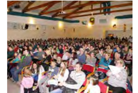
400 Besucher kamen zum Hirten- & Krippenliedersingen.

Am 3. Adventssonntag, dem 17.12.2017 fand das Hirten- und Krippenliedersingen der Kaindorfer Chöre zusammen mit der Musikschule und einer Volksschulgruppe statt. VON DAVID TEUBL