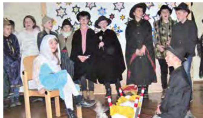
Die Schülerinnen und Schüler beim Krippenspiel