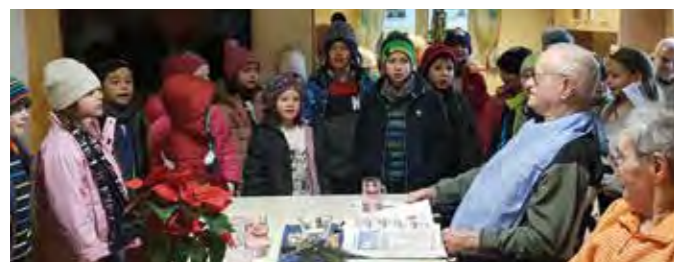
Weihnachtswünsche im Sonnengarten