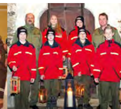
Die Jugendgruppe mit dem Kommando bei der Friedenslichtübergabe in St. Stefan