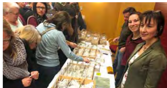
Das Angebot der Aussteller wurde von den vielen Gartenfreunden toll angenommen.