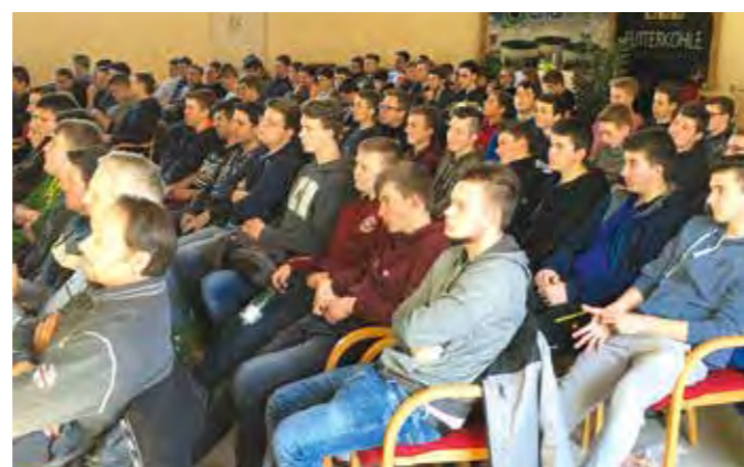
Premiere 2: Im Rahmen der 12. Auflage der Humus-Tage in Kaindorf nahmen zum ersten Mal Fachschüler von 6 Landwirtschaftsschulen teil.