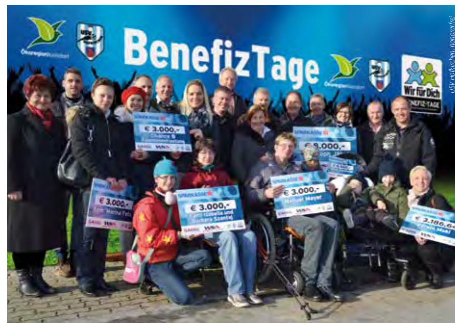
Das Engagement vieler heimischer Unternehmen und unzähliger freiwilliger Helfer des USV Hofkirchen konnte vielen steirischen Familien wieder Hoffnung geben.

Unter dem Motto „Wir für dich“ haben unzählige freiwillige Helfer des USV Hofkirchen und engagierte heimische Unternehmen beachtliche 120.000 Euro an Spendengeldern für in Not geratene Steirer in den vergangenen 5 Jahren aufgebracht.