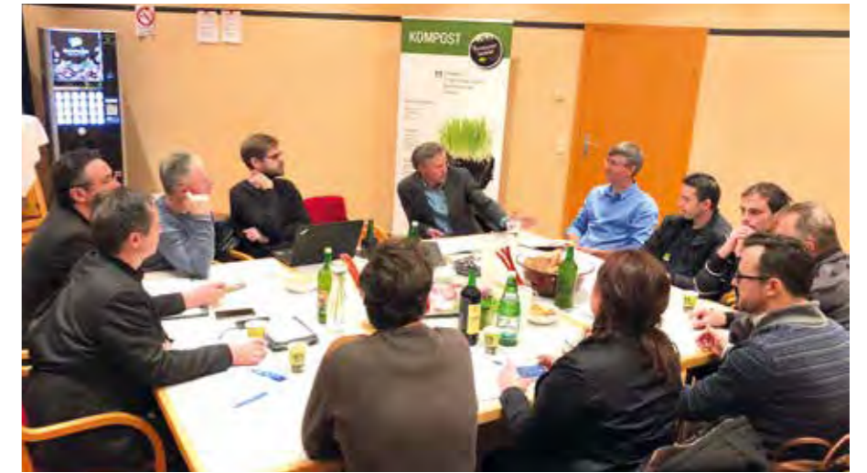
Premiere 3: Am ersten Abend der Tagung stimmten sich Vertreter aus Bayern, Slowenien und Belgien mit der Ökoregion Kaindorf ab, um das Humusprojekt nach Europa zu tragen.

Rund 160 Landwirte in ganz Österreich bewirtschaften mittlerweile auf einer Gesamtfläche von mehr als 1.700 Hektar ihre Ackerflächen nachhaltig, bauen Humus auf, binden CO 2 in großen Mengen im Boden und schützen damit unser Klima. Unternehmen wie Hofer, die VBV-Vorsorgekasse, sto GmbH, Malerei Herbsthofer, Grätzer Bräu, GOFAIR, Druckerei Janetschek und viele weitere Betriebe kaufen Zertifikate, um ihren nicht vermeidbaren CO 2 -Ausstoss zu