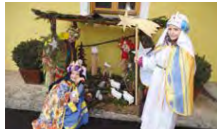
Die Hl. Drei Könige bei der Krippe