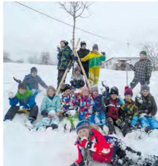
Unserem Klimabaum geht es auch im Winter richtig gut!

Nachdem bereits in den letzten Tagen des Novembers eine wunderbare Schneelandschaft zum Bestaunen und Genießen eingeladen hatte, gab es ein sehnsuchtsvolles Warten darauf, ob vielleicht die Weihnacht 2017 eine weiße werden könnte. Nun - wir wissen es: Diese Wünsche nach den weich und sanft hernieder schwebenden Flocken und nach dem Zauber einer schneebedeckten Winterwunderlandschaft am Heiligen Abend wurden nicht erfüllt. Mitte Jänner