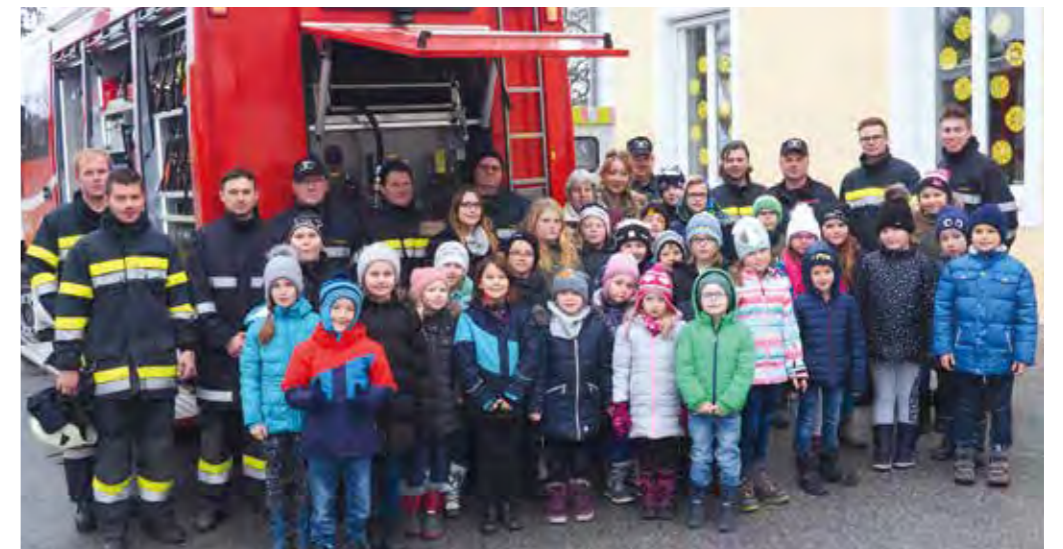
...nach der erfolgreich abgeschlossenen Übung...

dafür, dass sie ihre Freizeit dafür aufgebracht haben, diesen überaus wichtigen Beitrag zur Sicherheit an der Volksschule Auffen zu leisten. Mit dem bei der Evakuierungsübung angeeigneten Mehr an Wissen ist die Volksschule Auffen auf einen eventuell eintretenden Ernstfall sehr gut vorbereitet. ◀