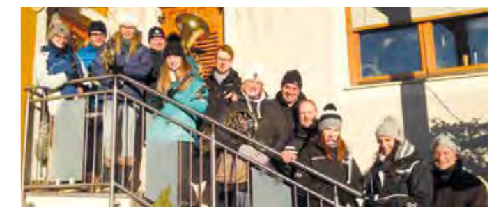
4 Tage lang waren die Neujahrgeiger im gesamten Pfarrrgebiet

...und bleiben Sie gespannt, was sich die Marktmusikkapelle Kaindorf beim Frühjahrskonzert am 27. und 28. April wieder hat einfallen lassen. So viel sei schon mal verraten: Bei „Hokus Pokus Blasmusik“ geht es bestimmt magisch zu! ◀