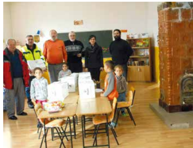
Die dankbaren Waisenkinder mit den Heimleitern und ehrenamtlichen Helfern aus dem Bezirk Hartberg-Fürstenfeld

Vor 3 Jahren habe ich begonnen, gebrauchte, aber noch schöne Kinderbekleidung, Schuhe, Spielsachen, Kuscheltiere usw. zu sammeln und alles sortiert und altersgerecht in Kartons verpackt, den Kindern in Rumäniens Waisenhäusern zukommen zu lassen. Mir ist es wichtig, dass alles zu 100% bei den Kindern ankommt. Wenn ich beim Auspacken meiner Packerln das Strahlen in den Augen der Kinder sehe, weiß ich, dass meine Arbeit richtig ist. Für Weihnachten 2017 habe ich für 153 Kinder Pakete vorbereitet. Ich habe mich riesig über so viel Ware gefreut. Vielen herzlichen Dank allen, die mir schöne Ware gebracht haben! ◀