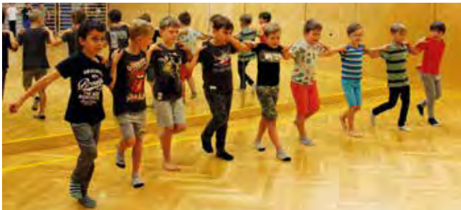
Die Jungs und Mädchen waren eifrig beim Tanzen.

mit einem Gottesdienst zu feiern. Für die Buben und Mädchen der 4. Klasse war das ein besonders aufregender und emotionaler Moment. Sie blickten auf ihre vergangenen Volksschuljahre mit Freude und ein bisschen Wehmut zurück. In diesem feierlichen Rahmen verabschiedeten sich alle Lehrerinnen und Kinder von der 4. Klasse, für die nun ein neues Kapitel in ihrem Leben beginnt. Bei einem gemütlichen Beisammensein und einer kleinen Agape, organisiert von den Eltern der 4. Klasse, fand dieses Schuljahr ein entspanntes Ende. Danke an die Gemeinde für das erfrischende Eis!