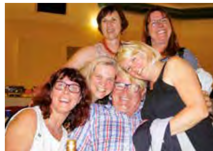
Einmal kuscheln bitte!

Eine Fotogalerie finden Sie auf www.mgv-kaindorf.at