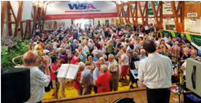
Die Mehrzweckhalle war bis zum letzten Platz gefüllt.

für eine volle Halle und beste Stimmung. Durch die Unterstützung zahlreicher Firmen konnten 150 Preise verlost werden. Für die musikalische Unterhaltung sorgten die „Gschoada Buam“.