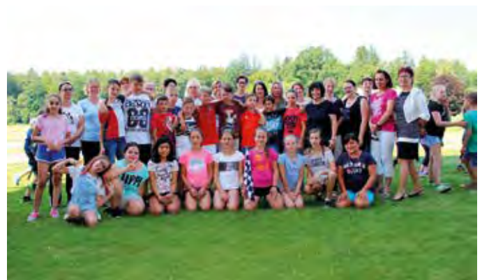
Die Kinder der 4. Klasse verabschiedeten sich von der Volksschule!