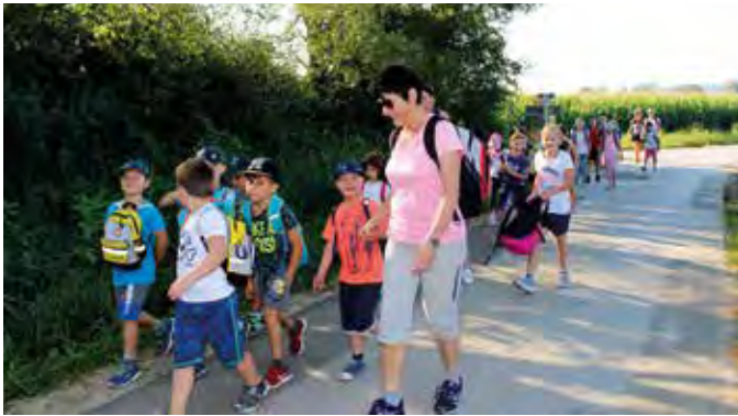
Die Volksschule wandert nach St. Stefan.