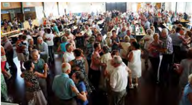
Die vielen Abordnungen der Seniorenverbände füllten die Erzherzog-Johann-Halle in Tiefenbach bis an den Rand.

renverbände aus den Bezirken Weiz und Hartberg-Fürstenfeld füllten die Erzherzog-Johann-Halle wieder bis an den Rand. Für eine volle Tanzfläche sorgten die „Gschoada Buam“.