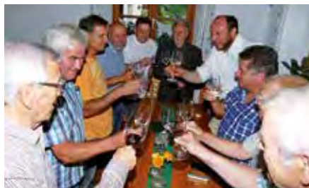
Prost hieß es beim Buschenschank.