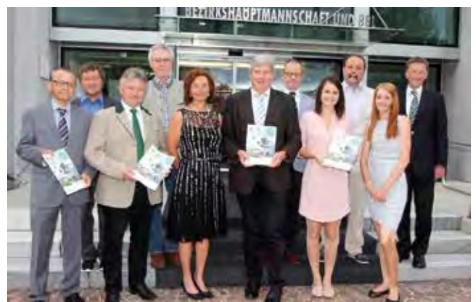
Referatsleiter und Mitarbeiter bei der Präsentation der Festschrift