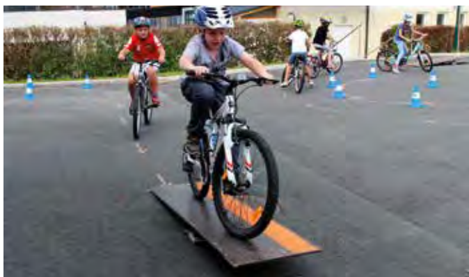
Geschicktes und sicheres Radfahren wurde trainiert.