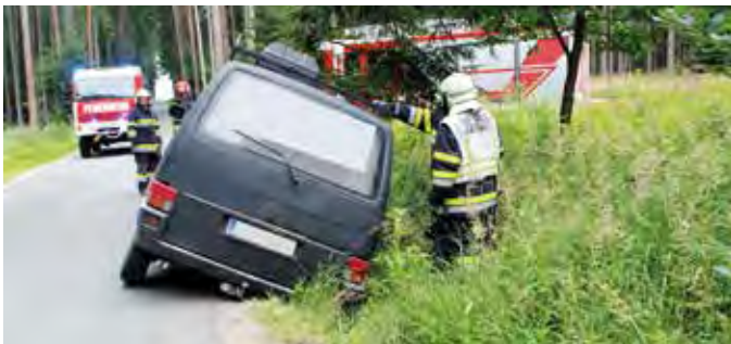
Bergung eines Kleinbusses, der nach einem Ausweichmanöver in den Straßengraben rutschte.