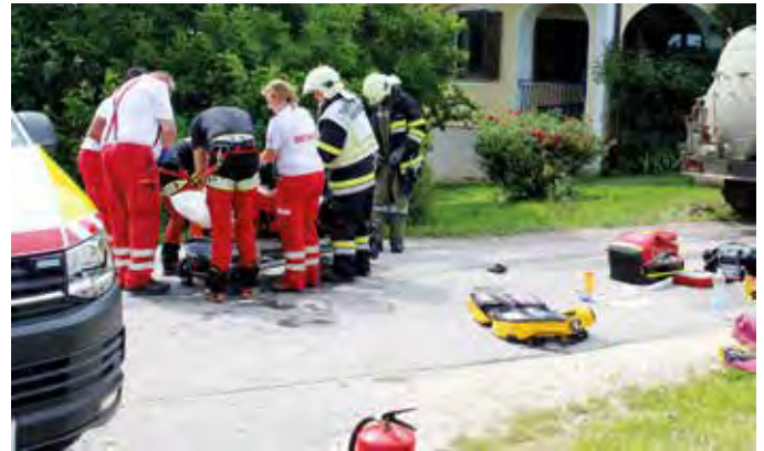
Ein Moped prallte auf einer Kreuzung gegen einen Güllefassanhänger. Dabei wurde der Mopedlenker schwerst verletzt.