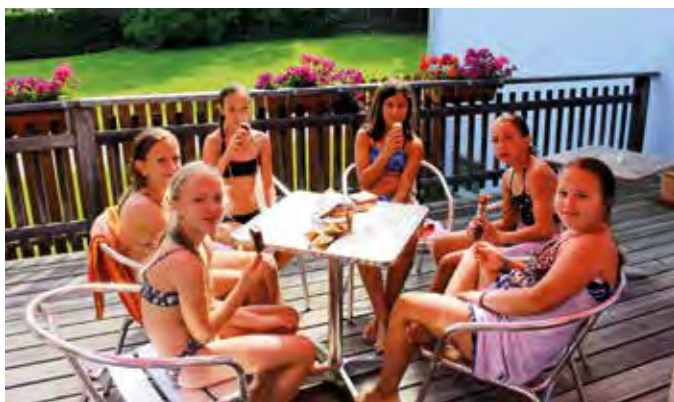
Danke für das leckere Eis!