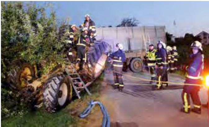
Gemeinsam mit der FF Pöllau wurde ein umgestürzter Traktor samt Anhänger in einer 3stündigen Aktion geborgen.