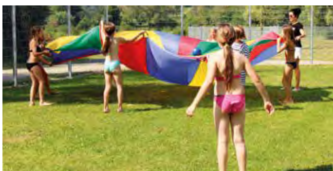
Spiel und Spaß im kühlen Nass!