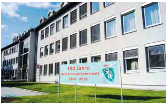
Außenansicht der Bezirkshauptmannschaft mit Transparent „150 Jahre Bezirkshauptmannschaft“

Ein weiterer Höhepunkt im Jubiläumsjahr 2018 ist am Freitag, dem 12. Oktober geplant. Dann wird in der BH Hartberg-Fürstenfeld ein Tag der offenen Tür mit verschiedenen Aktivitäten stattfinden.