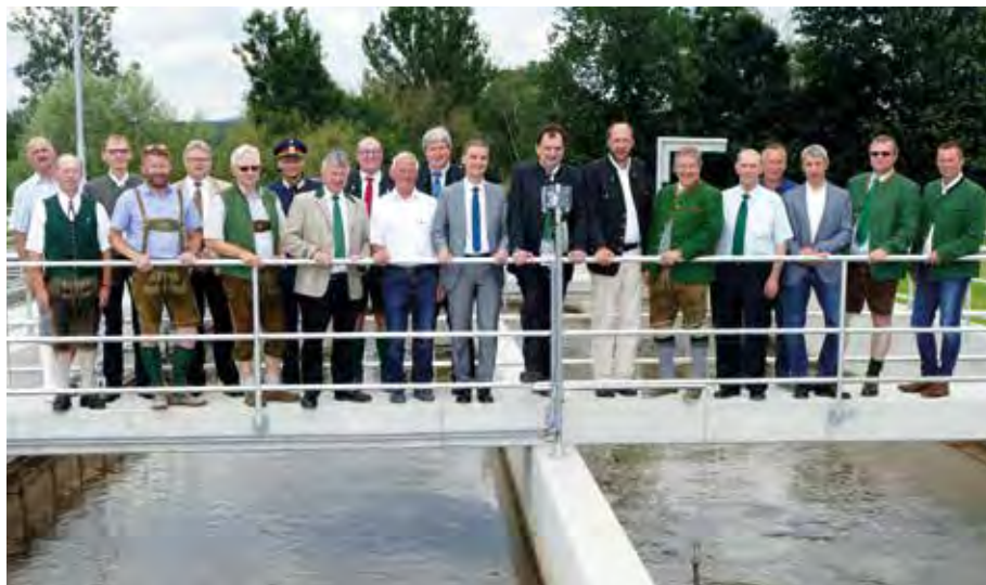
Viel Prominenz kam zur Eröffnung der erweiterten Kläranlage.

Neben der Erweiterung der Becken wurde auch die gesamte elektronische Steuerung erneuert. Auf der erweiterten Verbandskläranlage