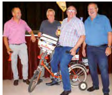
Das neue Dienstfahrzeug!