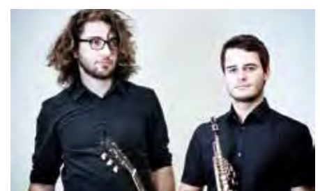
Das Duo 7000 spielt an der Jazz-Bar!